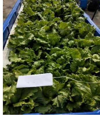
Resim 5. Iceberg marul çeşidinde her iki havuza besin çözeltisi uygulanmış, soldaki havuza VOSSG (A) uygulanmış ve sağdaki havuza VOSSG uygulanmamış (B) (16.03.2020).