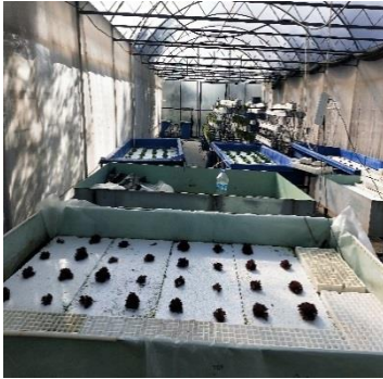
Resim 1. Deneme başlangıcı Marulların Besin çözeltisi ve VOSSG uygulanması (A-24.12.2019, B-30.12.2019).