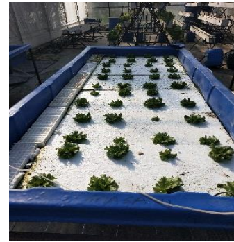
Resim 2. Denemenin genel görünüşü (21.01.2020).