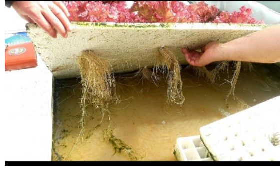
Resim 4. Lolo rosso marul çeşidinde kök gelişimi üzerine VOSSG 'in etkisi. Her iki havuza besin çözeltisi uygulanmış, soldaki havuza VOSSG (A) uygulanmış ve sağdaki havuza VOSSG uygulanmamış (B) (16.03.2020).