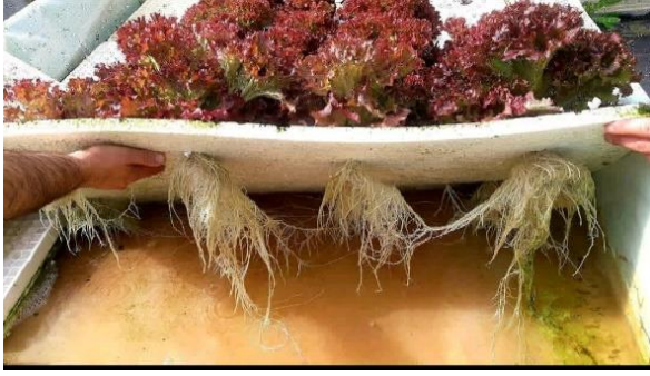
Resim 3. Lolo rosso marul çeşidinde bitki gelişimi üzerine VOSSG 'in etkisi. Her iki havuza besin çözeltisi uygulanmış, soldaki havuza VOSSG (A) uygulanmış ve sağdaki havuza VOSSG uygulanmamış (B) (16.03.2020).